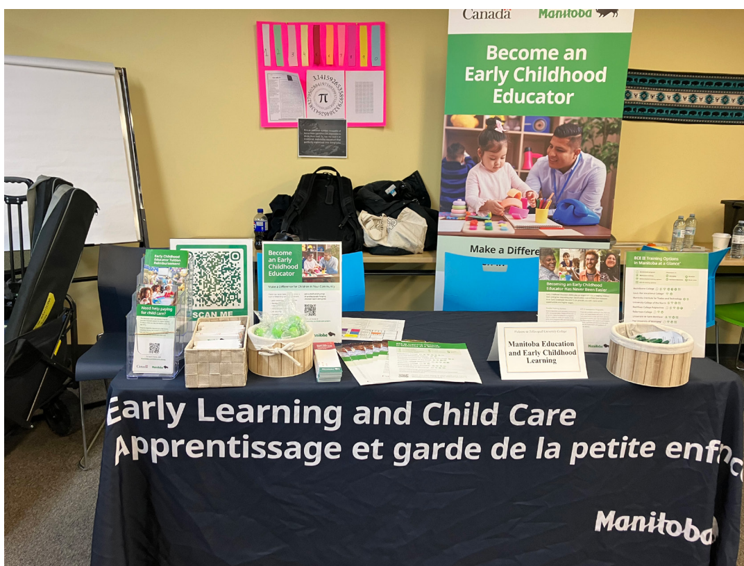
La table sur l'apprentissage et la garde des jeunes enfants du Collège Yellowquill abonde en matériel pédagogique destiné aux futurs demandeurs d'emploi et aux planificateurs de carrière.

Retrouvez notre kiosque prochainement au Collège Sturgeon Heights le 4 mars et au salon de carrière du Brandon Career Symposium les 17 et 18 mars. Nous sommes toujours ravis d'expliquer les parcours, les possibilités et le caractère enrichissant d'une carrière d'éducateur de la petite enfance!