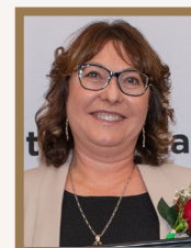
Ioulia Berdnikova University of Winnipeg Students' Association Day Care Centre, Winnipeg