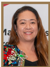
Zen Rio Quinsaat Fort Rouge Co-op Day Nursery, Winnipeg