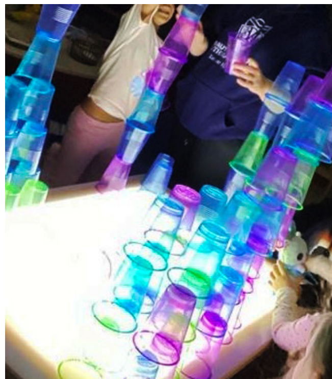
Les enfants de la garderie Beautiful Saviour Lutheran Child Care participent à une variété d'activités et de projets axés sur la STIAM, à l'intérieur comme à l'extérieur, toute l'année.